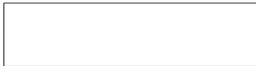
Схема границы балансовой принадлежности

д) границей эксплуатационной ответственности объектов централизованной системы водоотведения организации водопроводно-канализационного хозяйства и заказчика является: