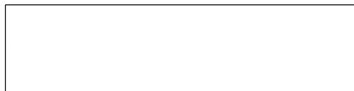
Схема границы эксплуатационной ответственности

Организация водопроводно- канализационного хозяйства